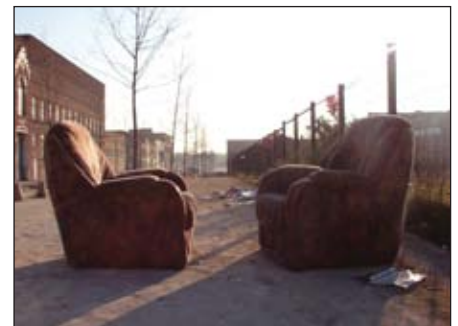
Un dépôt clandestin, rue du Nouveau Monde. Ces déchets auraient pu être portés à la Déchetterie de Roubaix

contraire, la vie publique est régie par tout un système de services attachés à la propreté du quartier : les poubelles passent deux fois par semaine, les encombrants une fois par mois ; pour les ordures il existe aussi la Déchetterie Municipale (gratuit pour les habitants), sans oublier effectivement le passage d'ilôtiers de manière ponctuelle, afin de clarifier les sols après passage d'Estera (jadis, la TRU). Et c'est donc à chacun de s'orga-