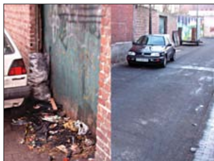
Une rue transformée en casse et en dépotoir où vivent quelques habitants mécontents (voir p.2)

qu'on appelle administrativement "les dépôts d'ordures clandestins". Ce sont des tas d'ordures, parfois dans des sacs poubelles ou jetés là, sur la voie publique, et qui se reproduisent à un rythme étonnamment régulier. Ils sont d'ailleurs repérés par les services municipaux ainsi que par certains habitants révoltés. Une autre mode consiste aussi à installer des "garages à ciel ouvert", activité qui peut