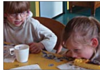
Des mamans et des enfants participent ensemble aux différentes activités proposées par le Comité de Quartier