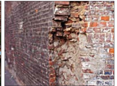
de gauche à droite : le mur d'une fresque détruite peu à peu, le sol recouvert d'hydrocarbures puants, l'espace vert devenu dépôt de merdes, et mur défoncé. A vous dégoûter de vivre à Roubaix.