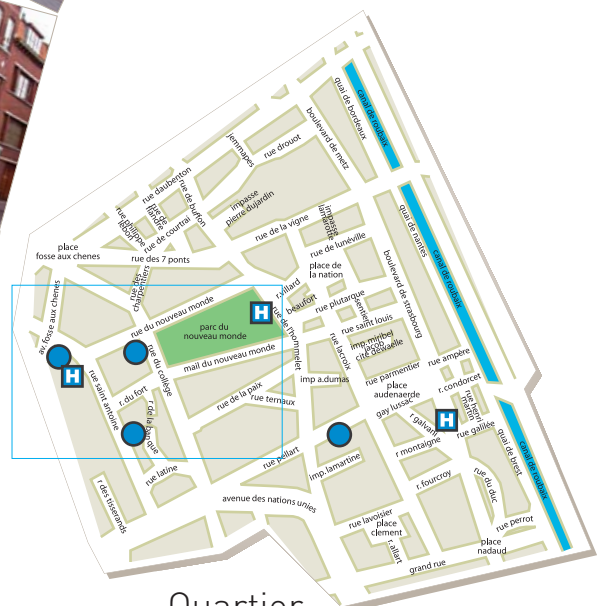
Quartier de l'Hommelet

Sur le plan ci-dessous, des espaces ouverts au public qui touchent au soin ou au médical, on peut citer : Hôpital de Jour Isabeau de Roubaix, (Psychiatrie), bd Strasbourg Le CAMPS, rue du Collège Le Relais, rue Saint-Antoine Le Bâtiment Psychiatrique, rue Fosse Aux Chênes Le V120, rue Fosse aux Chênes Les Résidences Hommelet, rue de l'Hommelet