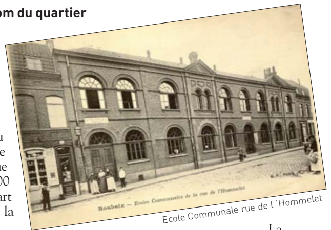
La brasserie coopérative du

De nombreuses courées ou impasse, comme celle de Balzac, composaient cette rue importante avec plus de 1500 habitants en 1911. La plupart des cours se trouvaient sur la partie détruite.