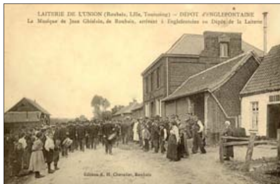
La musique du Jean Ghislain, à la laiterie de l'Union

Sources : Th Leuridan, histoire de Roubaix – Roubaix ancien et moderne chez H. PIQUE – Les Rues de Roubaix par les Flâneurs de la Société d'Emulation de Roubaix – Cercle des Collectionneurs des Arts de Roubaix.