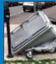
Poubelles taguées ou brûlées dans le quartier.