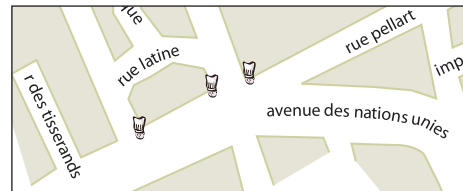
Les restos de l'avenue des Nations Unies