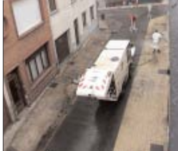
en haut : les taches d'huiles bien épaisses en bas : pendant le nettoyage

D'accord, on n'y était pas allé de main morte. Mais comprenez qu'une casse prenne possession d'une rue au mépris de toute propreté et du respect pour ses habitants, cela nécessitait un coup de projecteur vif. Peu après la parution d'Hommelet Infos, les démarches en cours de la Mairie de Quartier se sont vite finalisées : les forces de police ont débarqué pour vider la rue de ses occupants salissants et peu scrupuleux. Il aura fallu, comme annoncé, 3 mois de démarches. Et depuis, le service de la propreté urbaine intervient pour retrouver la clarté naturelle de la rue. Il faudra plusieurs passages pour venir à bout des hydrocarbures. ■