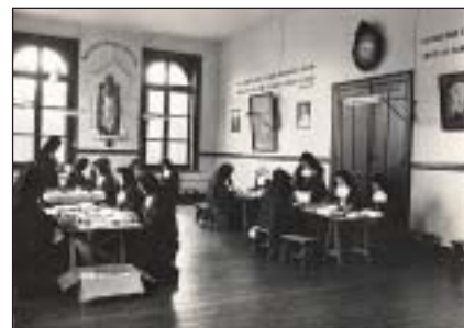
Les Moniales au travail