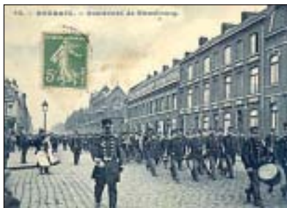
La fanfare du Jean Ghislain sur le boulevard