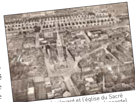
Vue du ciel : le boulevard et l'église du Sacré Coeur avant sa démolition (place Audenaerde). Au fond : le cimetière.

Cinéma , celui des Tramways. On y découvre aussi, l'école maternelle , le monastère de la Visitation (construit en 1877), devenu désormais la Chapelle de la Visitation (28/09/1975) en remplacement de l' Eglise du Sacré Coeur détruite pour cause de vétusté. Une école privée existe également sur le Boulevard. La Mutuelle Nadaud (Société de Prévoyance et de secours mutuels) y avait son siège.