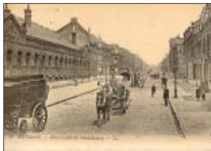
Ecole Maternelle, boulevard de Strasbourg

Un petit tour s'impose ! ■ Jean Pierre BOURGOIS